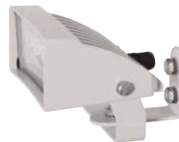
GEKO IRH WEISSES LICHT