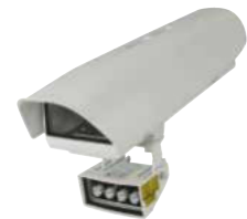
HOV + OSUPPIR + GEKO IRH